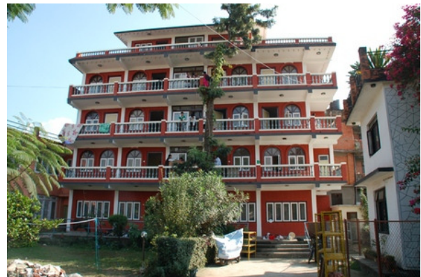
Ons huis, achter het hek